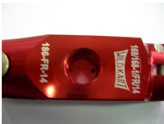
Maître-cylindre / Master-cylinder