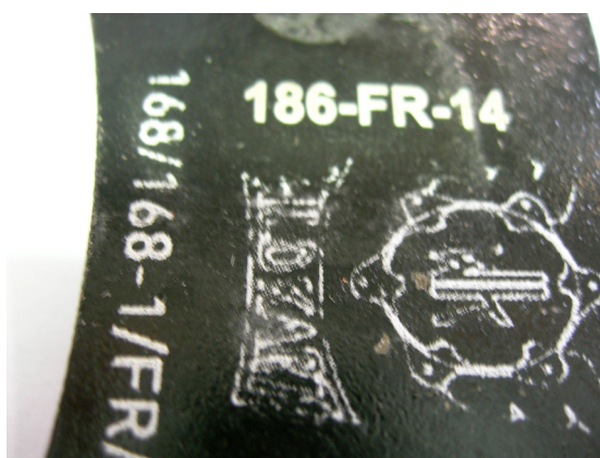
Tuyaux / Lines