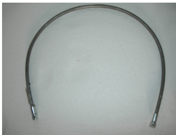
Plaquettes / Pads