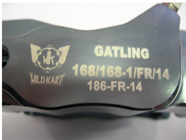
Etriers / Calipers