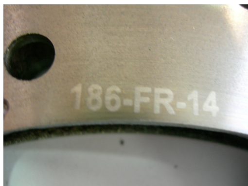
Disques / Discs